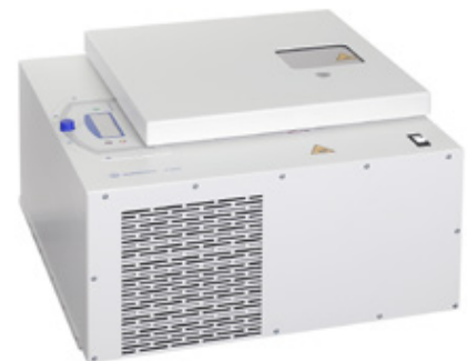
Roboter-Zentrifuge Sigma 4-5KRL