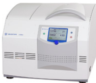
Tischzentrifuge Sigma 3-30KS