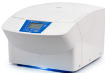
Tischzentrifuge Sigma 2-7