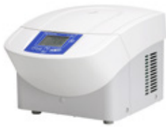
Mikrozentrifuge Sigma 1-16

Sigma bietet ein breites Produktportfolio mit mehr als 28 Laborzentrifugen. Diese können mit einer umfangreichen Auswahl an Festwinkel- und Ausschwingrotoren sowie einer Vielzahl von Zubehörteilen kombiniert werden. Wir haben für jeden Anwendungsfall die passende Gerätekonfiguration.